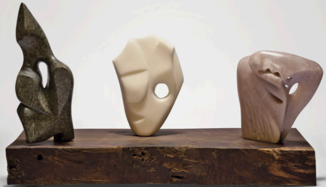
Liberté Egalité Fraternité

"Un esprit libre prend des libertés, même à l'égard de la liberté"